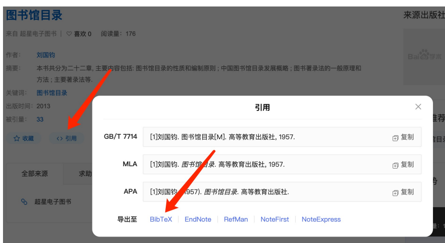
图 1-1 使用学术搜索查找文献引用代码

首先，使用各种学术搜索，查找需要引用的参考文献，然后点击“引用”，如图 1-1 所示 [1] 。