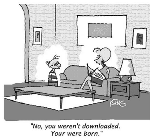
Figura 1 – Uma figura típica