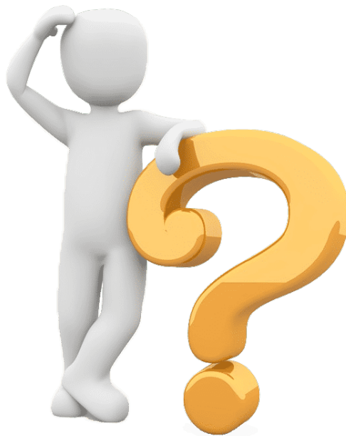
Figura 2 – Um exemplo de posicionamento de figura.

Para inserção de figuras, a legenda deve ficar acima, e fonte abaixo. Quando a fonte for o próprio autor, deve-se escrever "Fonte: acervo do autor". Para referencia a figura, use o ref, como "... Figura 2 .... ".