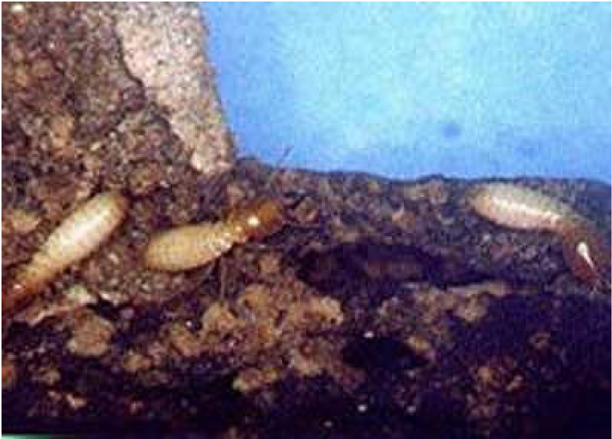
FIGURA 1.2 – Exemplo real de cupim frente ao seu dilema.

Segundo, o critério de otimização utilizado será o acoplamento entre as juntas do manipulador e neste caso, temos um sistema redundante quando ocorre falha de uma das juntas do manipulador de três juntas, e seu posicionamento é controlado pelas duas restantes. Nossa solução para o problema é baseada na formulação de redundância local, extensivamente estudada no contexto de cinemática inversa (nakamura). A principal contribuição deste trabalho é a extensão deste método usando as equações dinâmicas de manipuladores subatuados e a utilização do índice de acoplamento como um critério para a minimização do torque e da energia gasta pelo sistema durante o controle das juntas falhas.