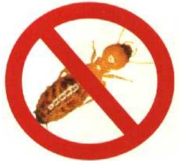
FIGURA 1.1 – Proibido estacionar cupins. Legenda grande, com o objetivo de demonstrar a indentação na lista de figuras.

Após a ocorrência de uma falha em um de seus atuadores, o manipulador torna-se um sistema subatuado. Um sistema também pode se tornar subatuado quando é projetado dessa maneira, ou quando o operador deliberadamente mantém um ou mais atuadores disponíveis inoperantes durante uma tarefa. Reduzindo o número de atuadores sem reduzir o número de graus de liberdade e ajustando-se o sistema de controle adequado, pode-se obter um mecanismo cujo consumo de energia é menor, mas cujas propriedades são mantidas (Arystides; Medeiros, 1997).