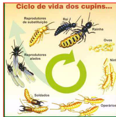
FIGURA A.1 – Uma figura que está no apêndice