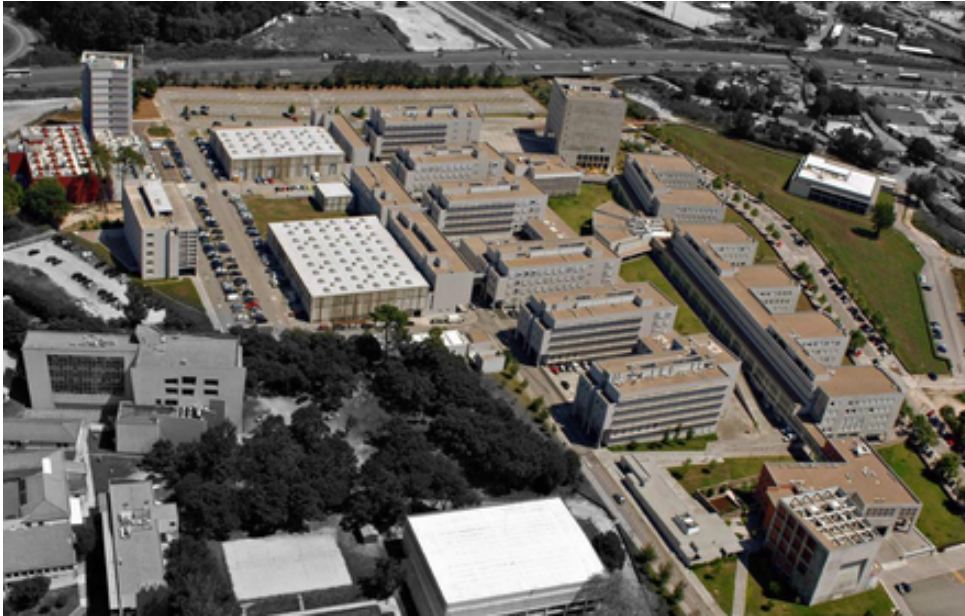
Figura 2.1: Fotografia aérea do Campus da FEUP (Espaço de Arquitetura 2020).