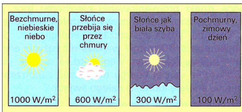
Rys. 3.2. Wpływ zachmurzenia na gęstość strumienia promieniowania

Rysunki oraz tabele (tylko dobrej jakości, min. 300dpi) występujące w tekście należy wyśrodkować. Każdy rysunek oraz tabela musi zawierać numer oraz podpis. Podpis umieszcza się pod rysunkiem oraz nad tabelą, tak jak to przedstawiają poniższe przykłady. Odstęp pomiędzy tekstem a rysunkiem wynosi jedną linię. Uwaga! Nie można wstawiać do pracy rysunków oraz tabel bez ich opisu/komentarza w tekście. Rysunek lub tabela pozbawione komentarzy w tekście są bezwartościowe i obniżają jakość pracy. Przykład: Wysokość i azymut Słońca we wszystkich porach roku przedstawia rysunek 2.1. Gęstość strumienia promieniowania zależy od zachmurzenia co ilustruje rys.2.2.